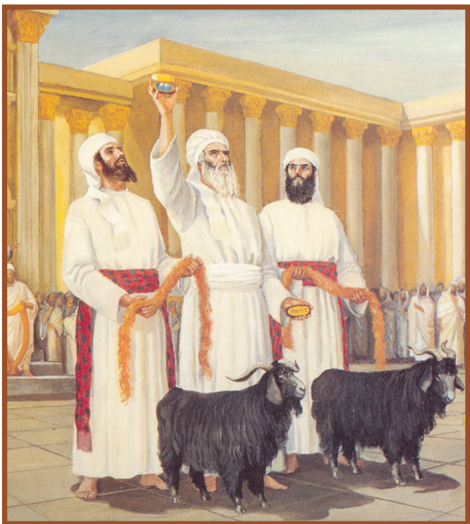
שעיר אחד לה' בימין ושעיר אחד לעזאזל בשמאל

אבני נזר: השעיר לה' קירב את ישראל לה', על כן עלה הגורל ביד ימין בבחינת: "ימין מקרבת" השעיר לעזאזל דחה את הפסולת והזוהמא מישראל, על כן עלה הגורל ביד שמאל בבחינת: "שמאל דוחה" חתם סופר וישמח משה: "כל פעל ה' למענהו", כל נברא צריך להשתדל שיתקדש שמים על ידו "וגם רשע ליום רעה", גם על ידי הרשע מתקדש שם שמים על ידי שהקב"ה מביא עליו מפלה במיתתו